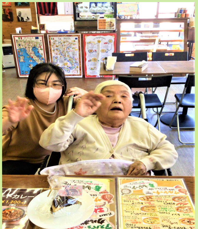
カマラードさんでお茶を楽しむ。おいしいチーズケーキとともに