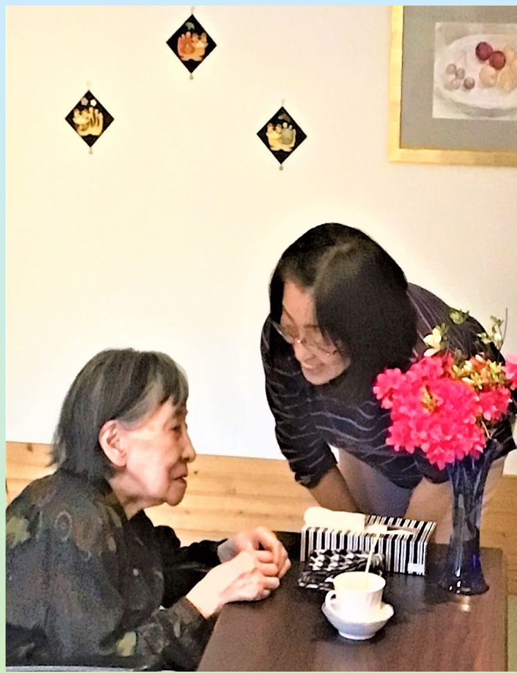
😊 あふれる笑顔 😊