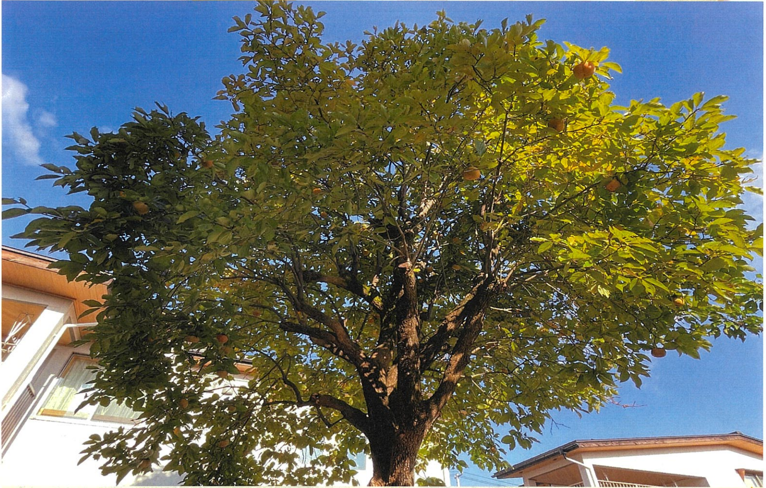
施設内の柿の木です。今年も立派に実っています！！

紅葉も散り始め寒さが増す日々が続いておりますが、皆さんはいかがお過ごしでしょうか。「実りの秋」と言うと美味しい物が沢山実る意味もありますが、「努力が結果をもたらすこと」と言う意味もあります。秋は色んな意味で一旦見つめ直す時期かもしれません。今年も感染対策に気を付けながら面会や外出、家族会での行事もでき、入居者、利用者の笑顔を沢山見ることが出来ました。これからも日々の生活が居心地の良いものになるように、継続できるように精進して参ります。冬のイベント等の計画も立てているので、引き続き協力の程よろしくお願致します。